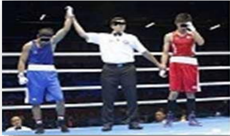
Uniforme arbitral para amateur.

Todos los oficiales, (árbitro central, los jueces, cronometrador y contador de patadas) vestirán pantalón negro, camisa blanca FEKM, deportivas negras, cinturón negro y pajarita.