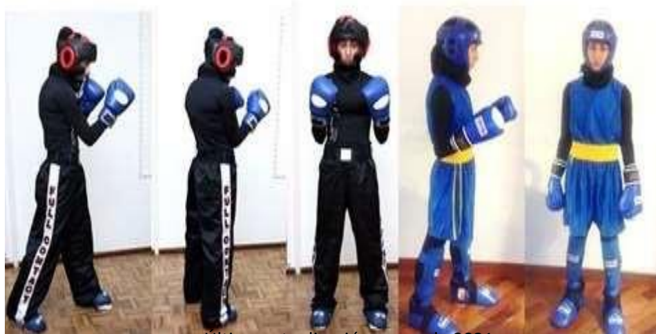
Ultima actualización enero de 2021

En todo caso deberán llevar cubierto todo el cuerpo, no se permite que sea parcial.